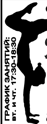
ГРАФИК ЗАНЯТИЙ: вт. и чт. 17:30-18:30